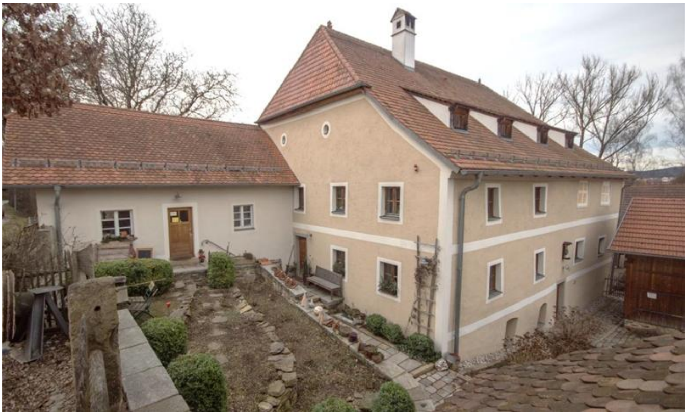
Veranstaltungsort Klostermühle Altenmarkt – ein Beispiel für Denkmalrenovierung